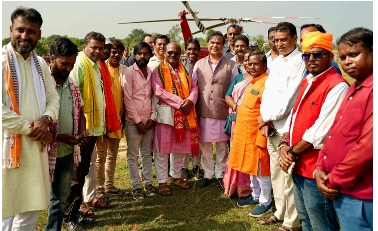
দীপাৱলীৰ দিনটোত ঝাৰখণ্ডৰ কাৰ্যকৰ্তাসকলৰ সৈতে অসমৰ মুখ্যমন্ত্ৰী

১,১১,৮০০ টকা জব্দ কৰা হয়। উক্ত বৃহৎ পৰিমাণৰ ধন ৰাশি এ এছ-০১ জি বি-২৬৬৩ নম্বৰৰ এখন গাড়ীত কঢ়িয়াই আনিছিল বুলি আৰক্ষীৰ এক সূত্ৰই জানিবলৈ দিয়ে। উল্লেখ্য যে, নিৰ্বাচনৰ সময়ত এনেদৰে বৃহৎ পৰিমাণৰ ধন কঢ়িয়াই অনাৰ কোনো ধৰণৰ নথি-পত্ৰ বাহনৰগৰাকীৰ হাতত নাছিল, যাৰ পৰিপ্ৰেক্ষিতত নিৰ্বাচনী বিধি উলংঘা কৰাৰ বাবে চামগুৰি আৰক্ষীয়ে উক্ত ধন ৰাশি জব্দ কৰে বুলি জানিব পৰা গৈছে।