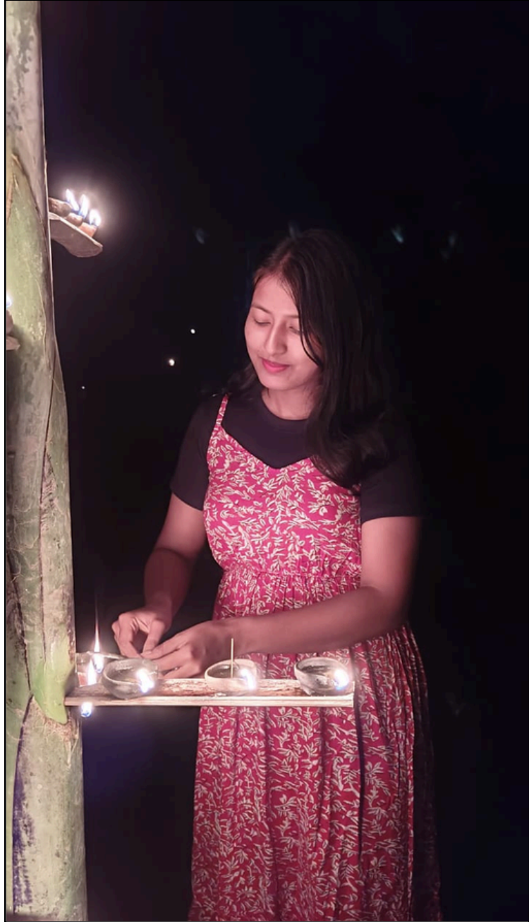
পোহৰৰ উছৰ দীপাঘিৰাত মাটিৰ চাকিৰে পদূলি পোহৰাই তোলা অৱস্থাত এনেদৰে দেখা গ'ল এগৰাকী যুৱতীক, লাহৰীঘাটত বৃহস্পতিবাৰে